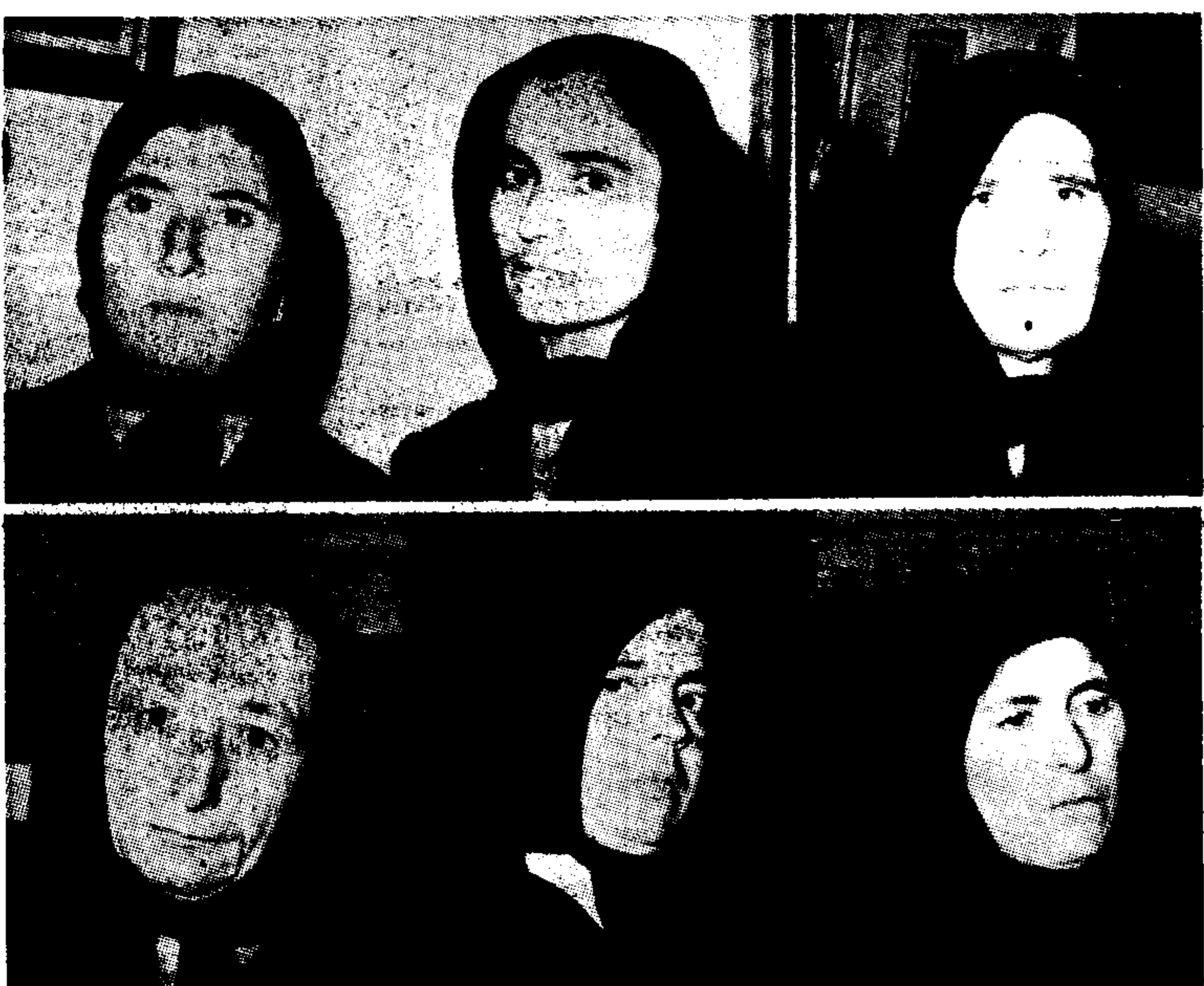
Οι μητέρες των έτυχων κοριτσιών, κειροφορεμένες, έδωσαν χθες στα Χανιά για να παρακολουθήσουν τη δίκη για τον πνιγμό των 21 κοριτσιών.